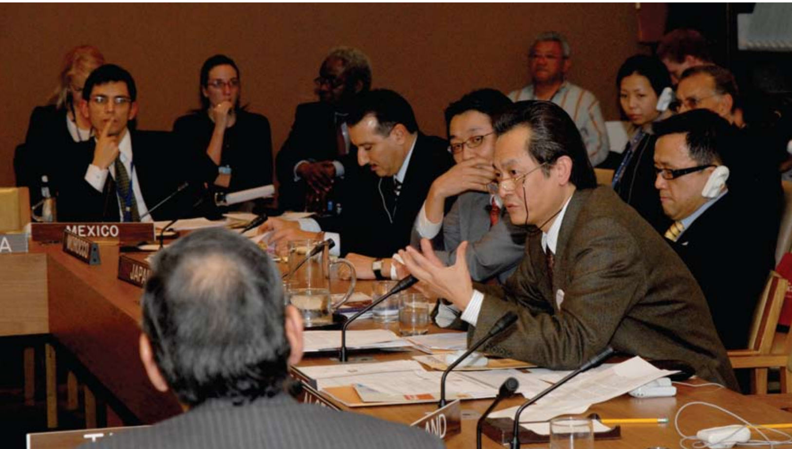
"Cursillo para profesionales de la cooperación Sur-Sur y Triangular" en diciembre, 2008