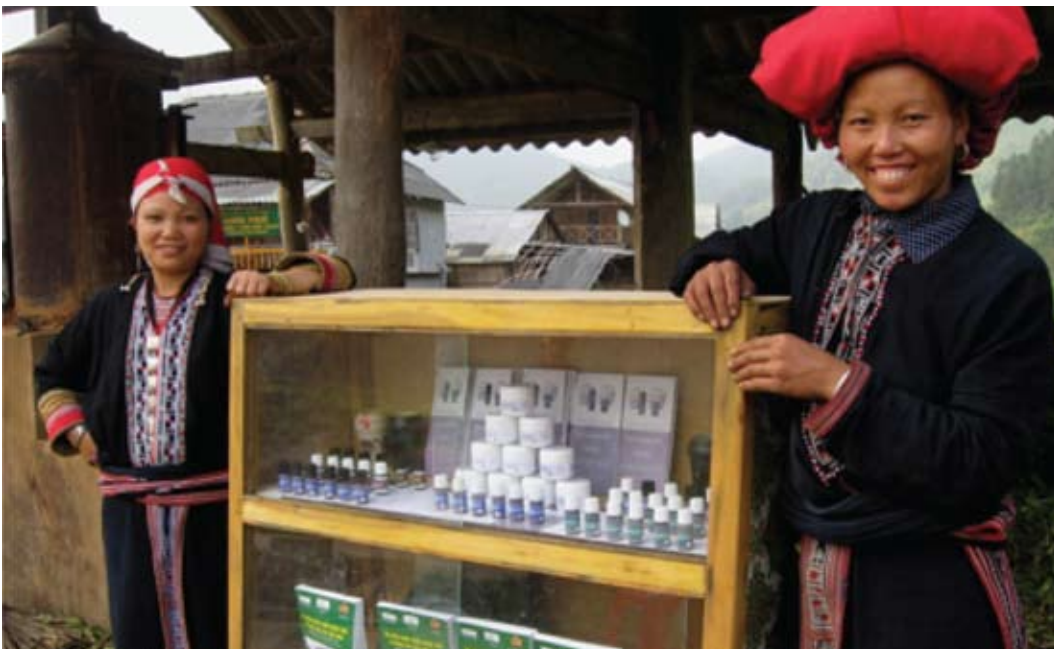
Protección de biodiversidad a través de la ganancia sostenible en Viet Nam