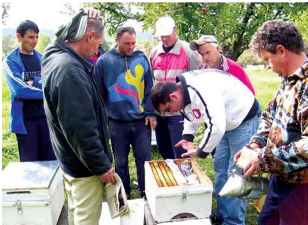
"Proyecto de apicultura em Macedonia"